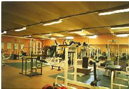
La salle de musculation