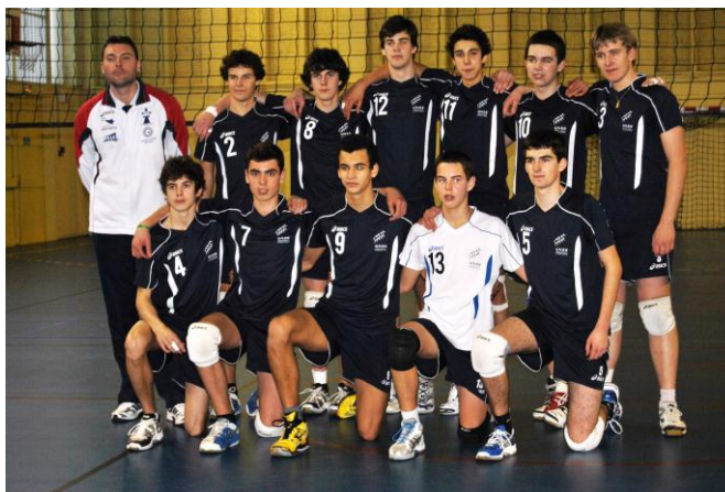
Promotion 2011 - 2012

Pôle Espoirs Masculins Dinard Saison 2012-2013